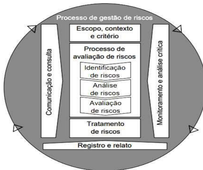
Processo de Gestão de Riscos ABNT NBR ISO 31.000:2018

Nesse 2º trimestre de 2024 o SENAI concentrou esforços significativos no aprimoramento das práticas de Gestão de Riscos em toda a organização. Esta iniciativa visa garantir que o SENAI-PA esteja bem-preparado para identificar, avaliar e mitigar os riscos de seus processos, garantindo a eficácia e eficiência das práticas de gerenciamento e monitoramento de riscos em toda a organização.